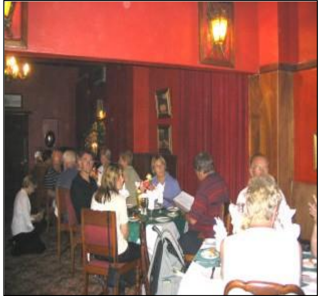
Dining room in het eigenlijke hotel.

Voordat het diner wordt geserveerd is een optreden gepland van twee lokale zangers. De gastvrouw introduceert de zangers en geeft toelichting. Ook de specifieke klaktonen (Xosa's) klinken luid tijdens de gezangen. Uitgebreid gefilmd en gefotografeerd en ook het aperitief smaakt goed. Naast mij staat een gast uit Hamburg, daar kom ik regelmatig. Leuke ervaring en vervolgens lopen we naar de diningroom voor het lopende buffet. Zoals uit de foto blijkt is de zaal antiek en warm aangekleed en het diner smaakt goed en er heerst een fijne sfeer.