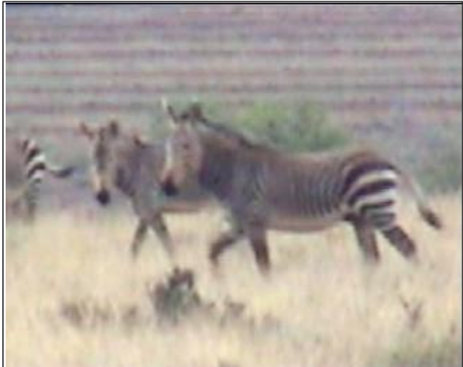
Foto rechts (gemaakt vanaf de film) laat de zebra's zien met hun karakteristieke strepen op de achterham. Ze zijn dus duidelijk anders.

Je krijgt een idee hoe deze streek er ongeschonden uit moet hebben gezien.