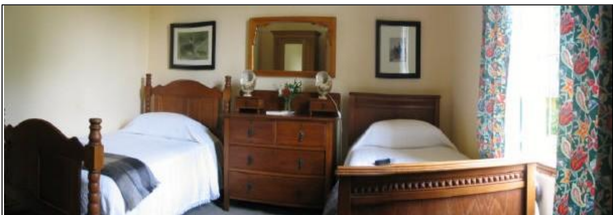
Met mezelf besloten het bed rechts te gebruiken om in te slapen, wie van de drie. (twee slaapkamers) Zie: http://www.tuishuise.co.za/