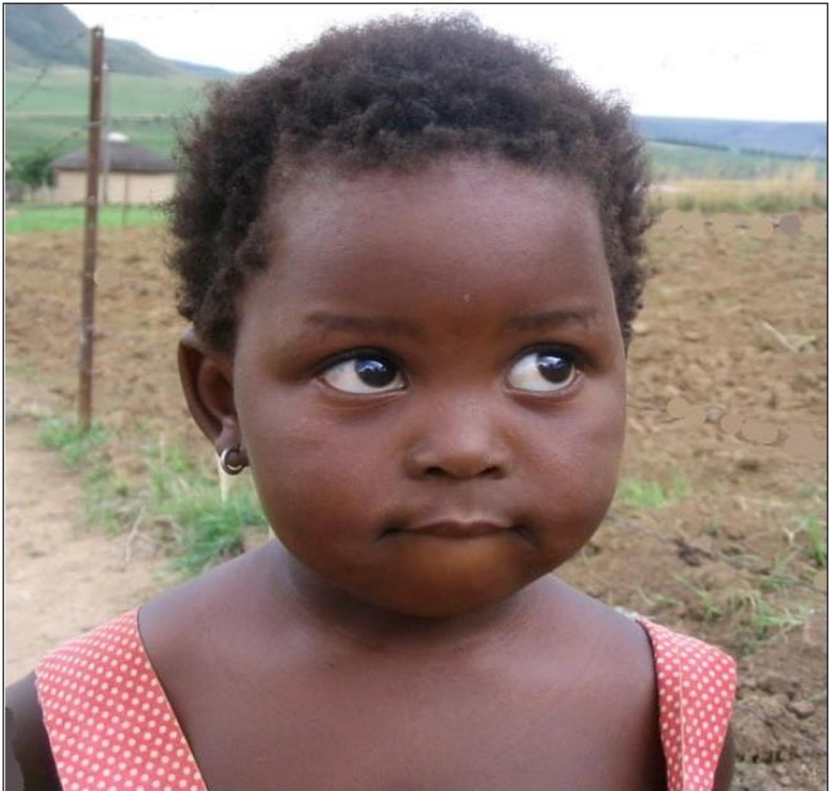
Enkele kinderen uit het dorp van de Zoeloestam. Wat zal hun toekomst te bieden hebben.