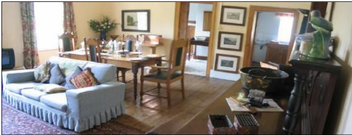
Woonkamer woning Frontier. Rechts zijn de deuren van de badkamer en de keuken te zien. Alles in de stijl des tijd. De deur links gaat naar boven en was niet beschikbaar evenals een kamer in gebruik voor het kantoor. Een van de slaapkamers in woning Frontier.