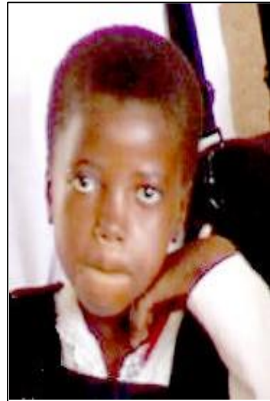
De hoofdonderwijzeres en glunderende kinderen.

We geven de hoofdonderwijzer geld en hopen dat het op de juiste plaats zal terechtkomen. Ik wou dat ik een pallet met schriften, pennen en boeken had kunnen meenemen. Het liefst een paar pallets vol. Ik zie het voor me, kinderen dolgelukkig met een schrift en een pen!