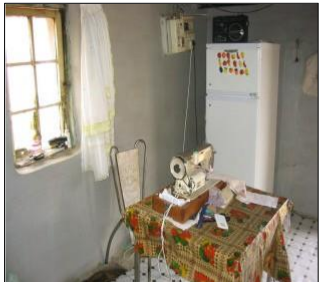
Voorkant keuken.....met naaimachine voor.....

We mochten ook dit huis bezichtigen (zouden wij dit ook doen?) en m.n. de keuken valt op met veel apparatuur, een stevig fornuis, koel/vriestkasten en zelfs een naaimachine. Ik denk dat dit huis een centrale plaats inneemt in deze samenleving. Big mamma is de echte kloek en heerst en beheert. Dat hebben we gezien bij het uitdelen van de zak met kleding.