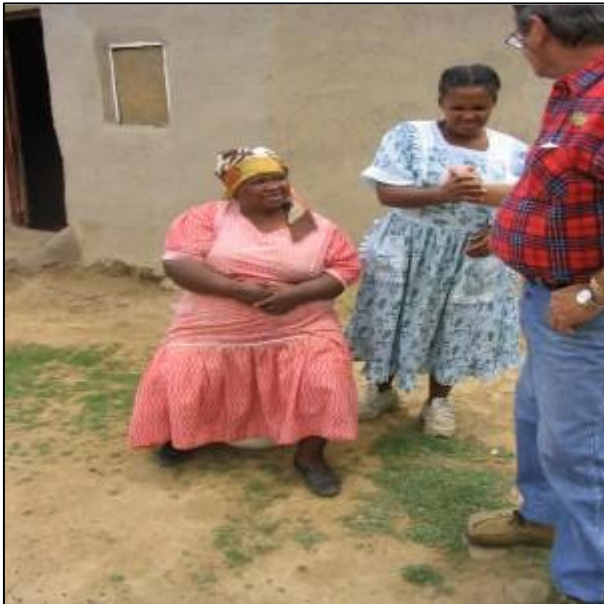
Vrouw van het opperhoofd met Douw.

Deze dorpen hebben een sterke sociale binding, 1 persoon, die werk heeft in een stad, zal geld overmaken voor de hele familie. Huisvesting kost bijna niets en traditioneel wordt weinig kleding gedragen. Conclusie; ook met weinig materiele welvaart is er welbehagen en welbevinden.