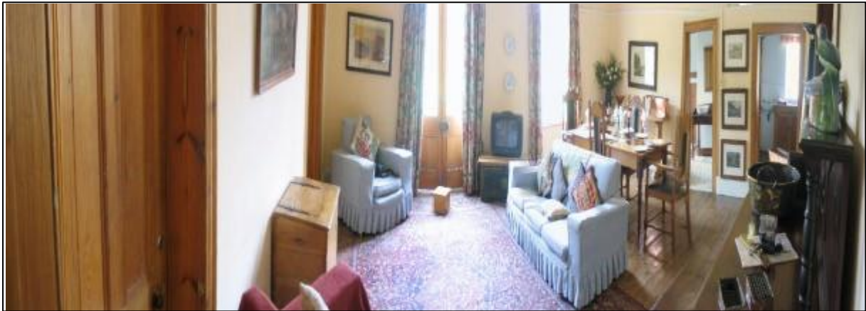
Panorama woonkamer, deur links achter leidt naar onderstaande slaapkamer.

De huisjes zijn erg oud en zijn hard toe aan onderhoud en ik heb een sleutelbos met "diverse" sleutels in allerlei formaat.