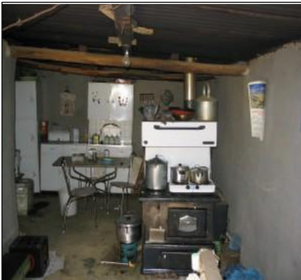
Achterkant met keuken, veel apparatuur.