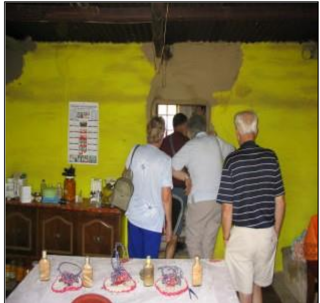
Bezichtiging van het huis, de woonkamer met deur naar keuken